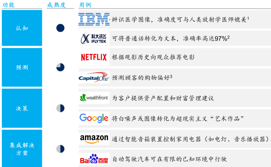
图1：人工智能不同技术领域的商业化程度